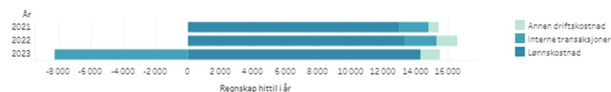
Figur 1 Utvikling kostnader totalt Tall i 1000 kroner

Utvikling i kostnader totalt på instituttet (GB + BOA) sammenlignes mot 2021-2022 i figur 1. Lønnskostnadene per mai i 2023 har vært på 14,294 mill. kr, interne transaksjoner 2 (i dette tilfellet som inntekter) på 8,227 mill. kr og andre driftskostnader på 1,186 mill. kr. Lønnskostnadene har økt med ca. 1 mill. kr siden 2022, mens det er en mindre nedgang i driftskostnadene. Den store endringen i interne transaksjoner skyldes at øvrige fakultet ved UiB har i 2023 blitt internfakturert tidligere enn før for ex.phil undervisning i vårsemesteret. Nesten hele økningen i lønnskostnader er på ex.phil med 0,9 mill. kr høyere kostnader enn i tilsvarende periode i 2022.